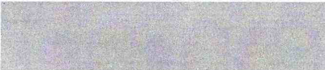
Nombre y firma de la persona servidora pública que recibe este Informe